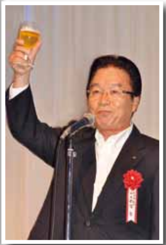
乾杯の首頭をとる九州市長会の釘宮磐会長(大分市長)