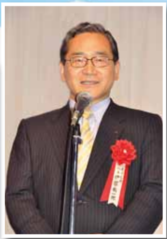
来賓を代表して九州地方知事会の伊藤祐一郎副会長(鹿児島県知事)が挨拶