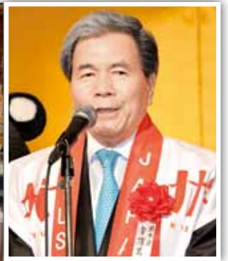
来賓挨拶する蒲島郁夫熊本県知事