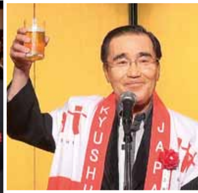
乾杯の発声をとった森博幸鹿児島市長(九州市長会会長)