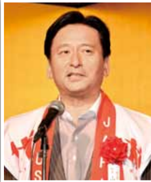
来賓挨拶する山口祥義佐賀県知事