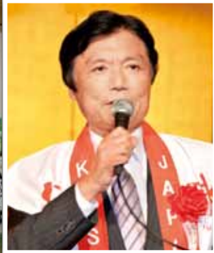
来賓挨拶する小川洋福岡県知事