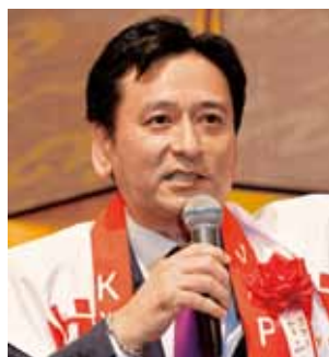
来賓挨拶する山口祥義佐賀県知事