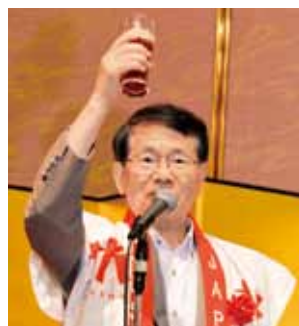
乾杯の発声をとった九州大学の久保千春総長