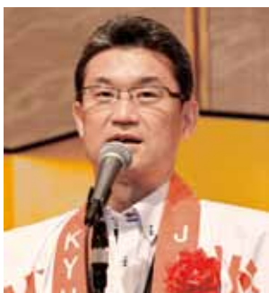
来賓挨拶する河野俊嗣宮崎県知事